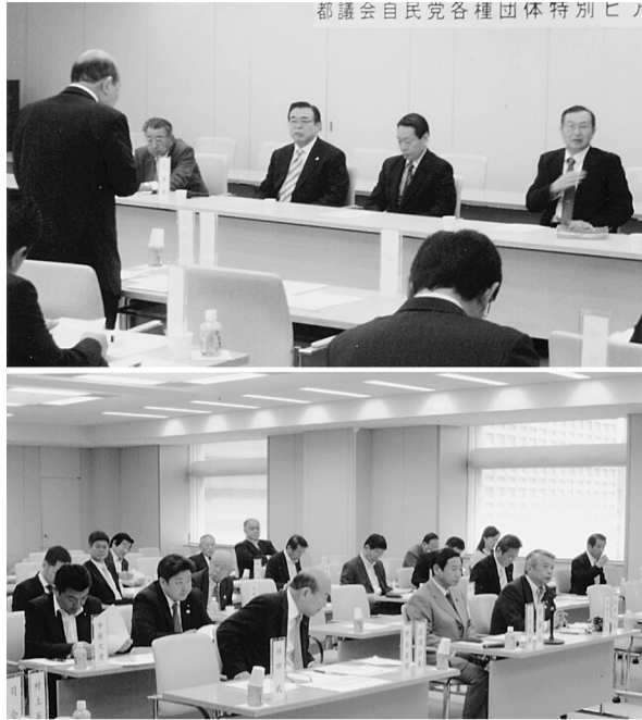
5月16日に開かれた都議会自民党の「各種団体特別ヒヤリング」。業界の被災状況説明と提言を行いました

これは都議会自民党各団体にヒヤリングを、東日本大震災に被災した被災地への復興支援と都内における被害対応、また、将来に向けた防災力の強化を図っていくとして、「東日本大震災復旧・復興対策本部」を設置し、その一環として各種団体を対象に①被災状況②被災に対する支援要望・提言③電力需要抑制に対する要望④被災地支援への取り組みなどについて、