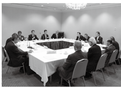
賀詞交歓会に先立ち、小会場「東山」にて開催された理事会

員連盟の内田茂会長にそれぞれ祝辞を賜った。続いて壇上に3樽をセットして鏡開き。乾杯のあと、祝電や国会議員、都議会議員の方々を紹介。ほかに琴の演奏などもあり、盛会のうちに終わった。