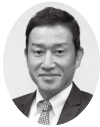
東京ビルメンテナンス政治連盟