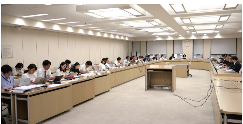
概要説明の様子 (都議会立憲ミライネット・無所属の会)

発展に取り組んでおります。東京都の入札につきましては、先生方のご支援の下、ゼロ都債の活用による入札時期の前倒しや入札参加資格者の社会保険加入の確認等、実現した要望も多々ございます。私どもといたしましては、公