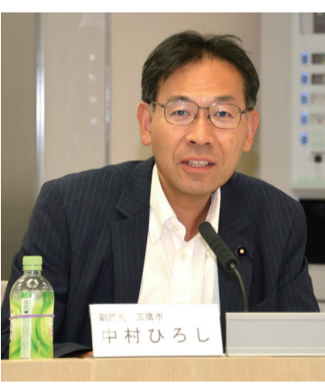
都議会立憲ミライネット・無所属の会 中村ひろし議員