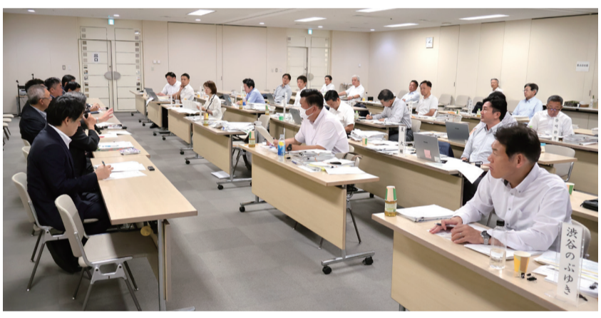
概要説明の様子 (都議会自民党)