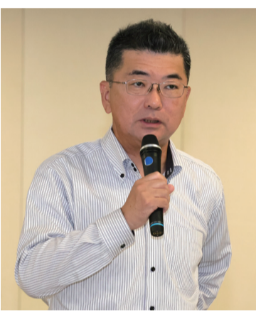
都議会自民党伊藤祥広議員